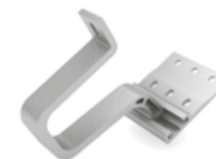
K2 SingleHook 1.4 - Twist Bracket STS