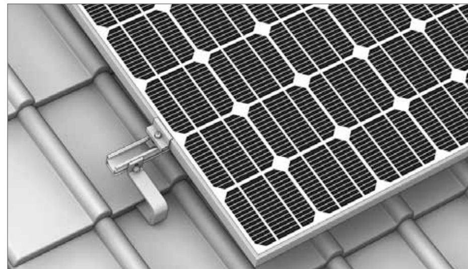
Ilustracja systemu - Montaż SingleHook - System Singlerail