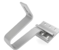
K2 SingleHook 2.3 - Long Bracket STS